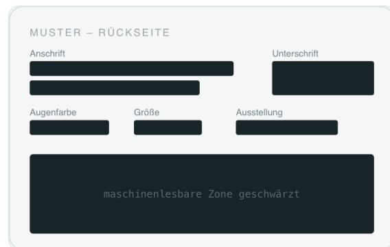
Rückseite: enthält keine benötigten Angaben, vollständig schwärzbar.

Eine vollständige Ausweiskopie ist nicht nötig. Schwärzen Sie bitte alle Angaben, die wir nicht benötigen. Das schützt Ihre Daten und entspricht dem Grundsatz der Datensparsamkeit.